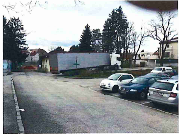
Viel zu großer LKW! Vereinbart war eigentlich ein 3 Achser; mit Glück konnte er am Parkplatz umdrehen