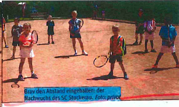
Brav den Abstand eingehalten: der Nachwuchs des SC Stockerau.