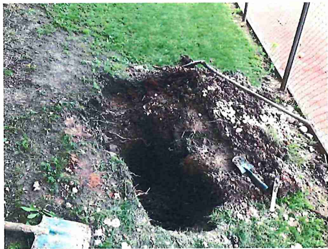
Rohrbruch bei der Bewässerung ( Günther )