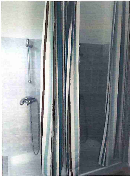
Neues Dekor für unsere Duschen ( Barbara )

Außer für die Heizungs und die Kühlanlage benötigen wir keine Fremdleistungen! Rasenmähen, Grünschnitt, Unebenheiten ausbessern, Platz händisch bewässern,.... Sehr viel Arbeit das ganze Jahr! Und zusätzlich noch Renovierungen und Reparaturen!